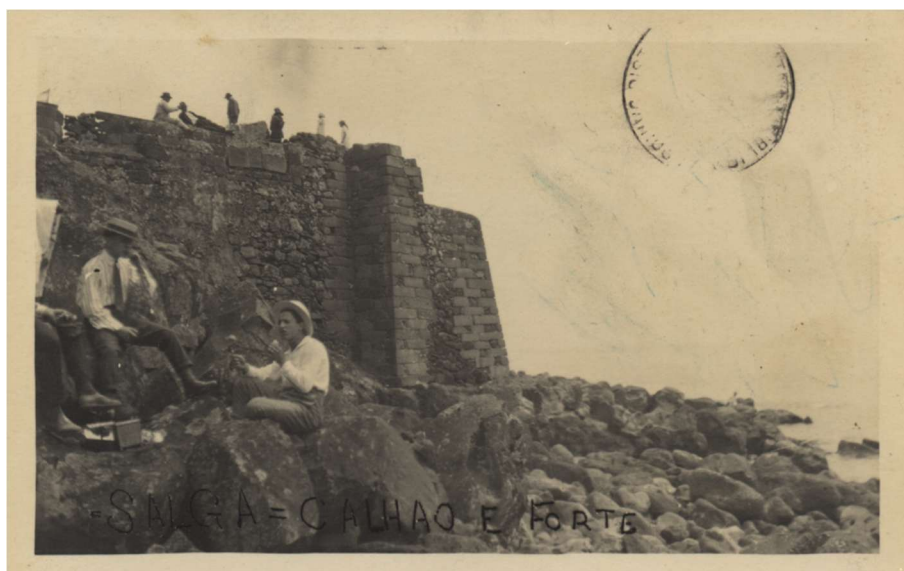
Figura 3 - "Salga = Calhão e forte"

população local, com poucos recursos militares, organizou uma resistência improvável. Segundo a tradição, os habitantes soltaram gado bravo contra as tropas invasoras, causando desordem e contribuindo para a sua derrota.