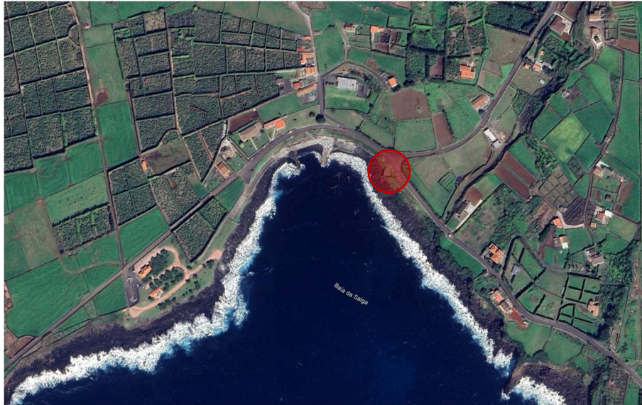
Figura 1 - Localização

O Forte do Reduto da Salga é uma pequena fortificação costeira situada na freguesia de São Sebastião, no concelho de Angra do Heroísmo, na ilha Terceira, nos Açores. Encontra-se implantado junto à Baía da Salga, numa zona litoral de grande valor paisagístico e histórico, marcada por arribas e uma vista ampla sobre o Atlântico.