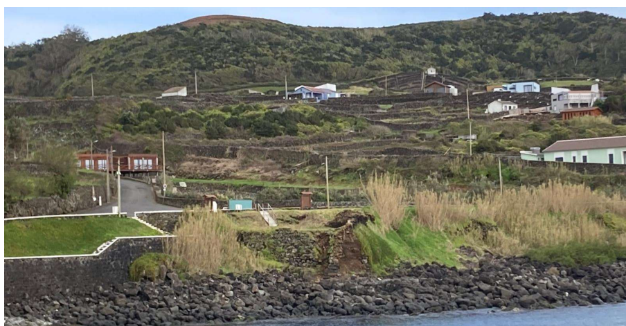
Figura 4 - Estado atual

Embora o forte atualmente visível possa ter sofrido alterações ao longo dos séculos, a sua presença está ligada a esse sistema defensivo e à memória destes acontecimentos. Estruturalmente, trata-se de um reduto de pequenas dimensões, concebido para vigilância e defesa costeira, com características simples adaptadas ao terreno.